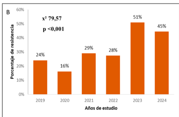
Figura 2. Resistencia a Fluorquinolonas de S. aureus durante el periodo de estudio. La diferencia interanual fue estadísticamente significativa p < 0,01 . A: Resistencia a ciprofloxacin. B: Resistencia a levofloxacin. ( \chi^2 ): chi-cuadrado. p : Valor probabilístico

respectivamente, con significancia estadística ( X^2 = 10,68 ; p=0,060 ) (Tabla 3). En el caso del Fenotipo M, su mayor frecuencia se observó en el año 2021 (29,6 %), 2023 (36,4 %) y 2024 (26,2 %) y estadísticamente significativo ( X^2 = 52,4 ; p > 0,001 ) (Tabla 3).